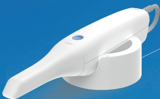
le scanner intra-oral Médit i500 valeur 20280 euros TTC

LA MEILLEURE OPPORTUNITÉ DE L'ANNÉE POUR PASSER AU TOUT NUMÉRIQUE