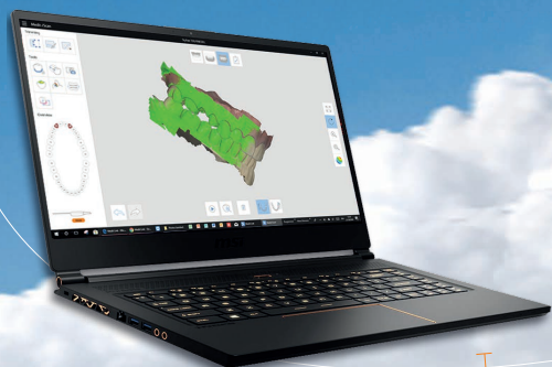
L'ordinateur MSI GS65 valeur 2681 euros TTC