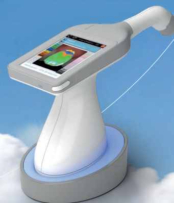
Le teintier numérique Rayplicker valeur 2400 euros TTC