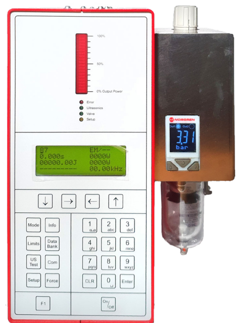
Ultraschall Generator: 20kHz mit digitaler Druckanzeige